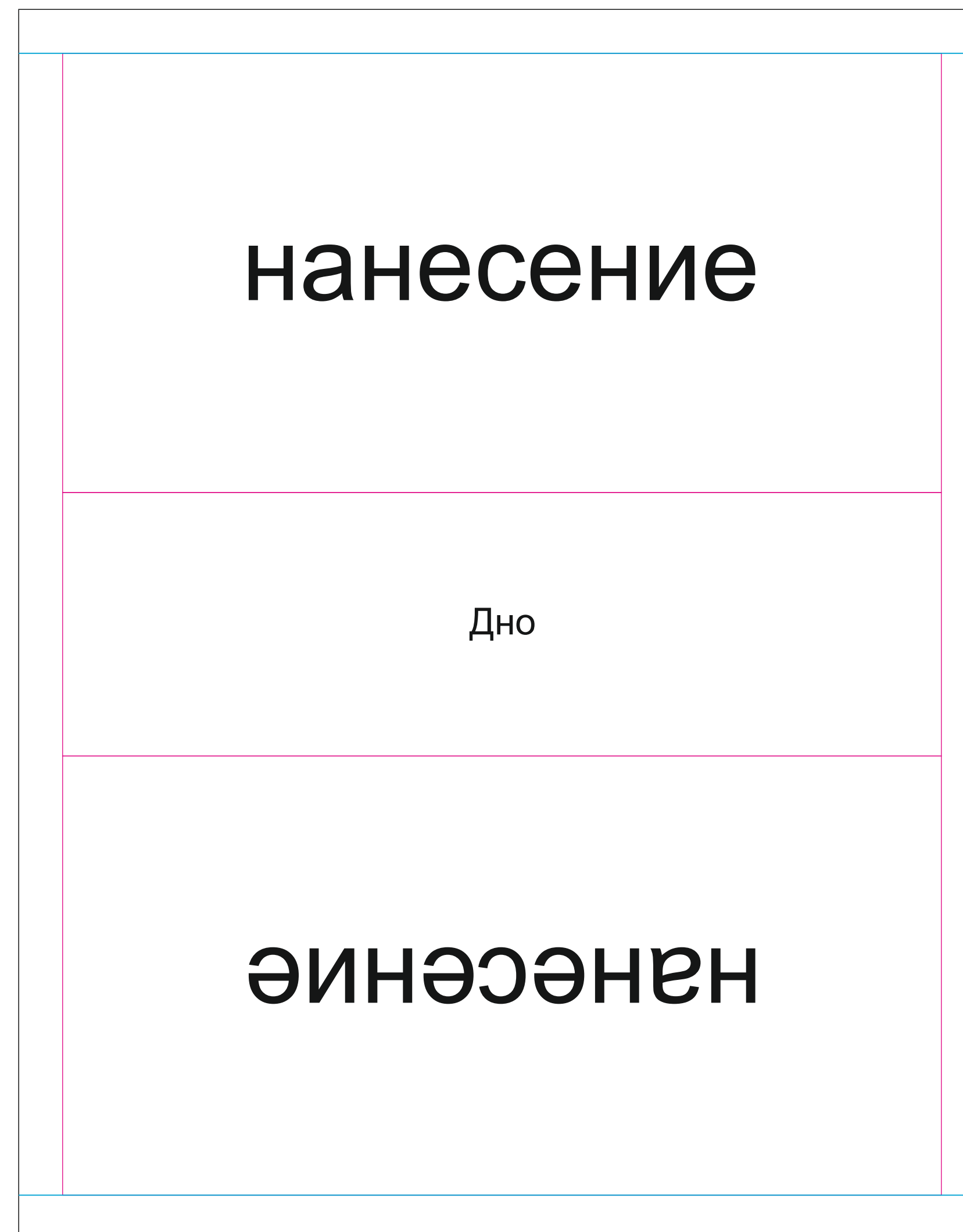
Косметичка с дном 20x10x6